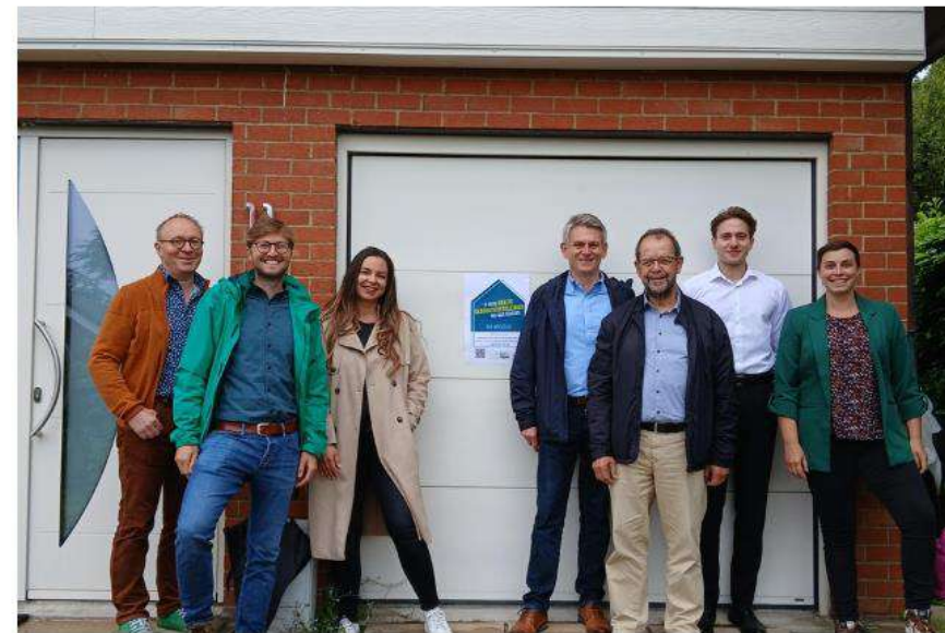
De bevoegde schepenen van de Druivenstreekgemeenten zijn tevreden met de resultaten.